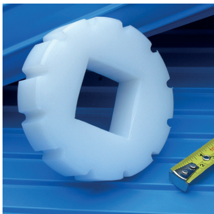
Engranaje de 1"

* Los tamaños de chavetero imperiales en diámetros interiores redondos cumplen con la norma ANSI B17.1-1967 (R1989); los tamaños de chavetero métricos cumplen con BS 4235: Parte 1: 1972 (1986)